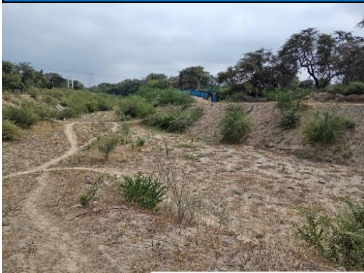
FOTO N° 02 Se observa posible afectación por erosión aguas arriba de la confluencia del río Taymi Antiguo y Rio Loco .