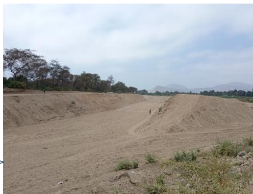
FOTO N° 01 Se observa la población expuesta aguas abajo de la confluencia del río Taymi Antiguo y Rio Loco.